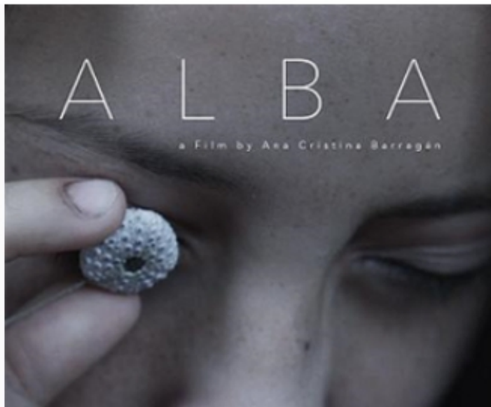
Afiche de la película Alba que se presentará en la Casa de la Cultura Ecuatoriana por Zoom.

CULTURA | 22 de septiembre, 2020 - 18h37